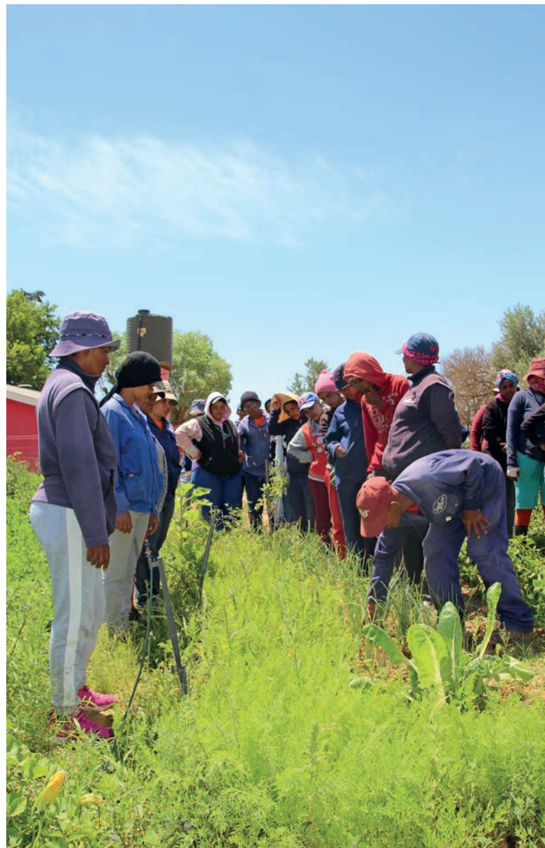
La primera cosecha en el jardín de permacultura.