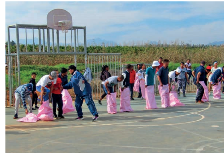
Hubo diversión para todos en el Día del Deporte en Sudáfrica.

¡Genial, lo que un desayuno conjunto puede hacer!