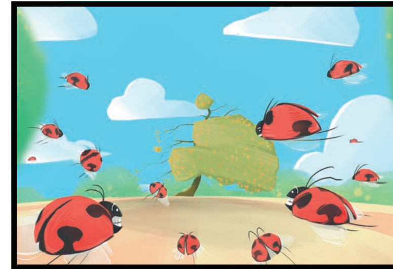
Pero las cochinillas tienen enemigos naturales – las mariquitas.

El mandarín y el naranjo, por ejemplo, son atacados por cochinillas acanaladas ( Icerya purchasi ), que chupan la savia de las plantas. La mariquita ( Rodolia cardinalis ), se alimenta de cochinillas acanaladas y se los come. Así, protegemos a los cítricos de forma natural.