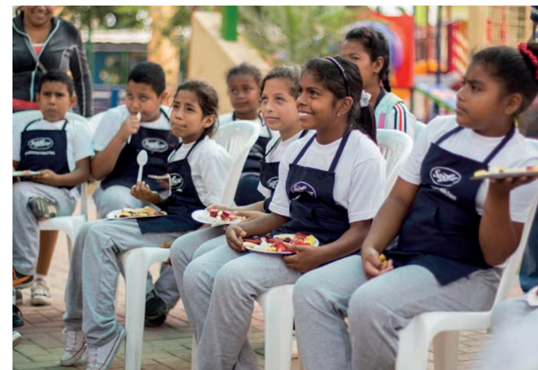
Los niños de la escuela deportiva de Ecuador disfrutando de divertidos platos de fruta.

No es ningún secreto, que una dieta equilibrada es la clave para una vida larga y saludable. Aquellos que son introducidos a las frutas y vegetales de una manera lúdica y divertida desde pequeños desarrollarán hábitos saludables para toda la vida. Porque en la infancia se asientan las bases de los futuros hábitos alimenticios y de la salud. En nuestras fincas promovemos una dieta variada y saludable, incluso para los más pequeños, con la ayuda de talleres lúdicos de nutrición, como por ejemplo, en Ecuador, Sudáfrica o en nuestros comedores El Puchero en España.