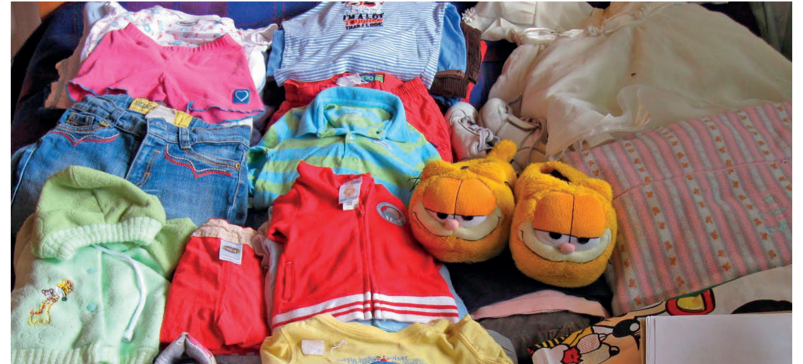
Donación de textil en nuestra sede en Puzol.