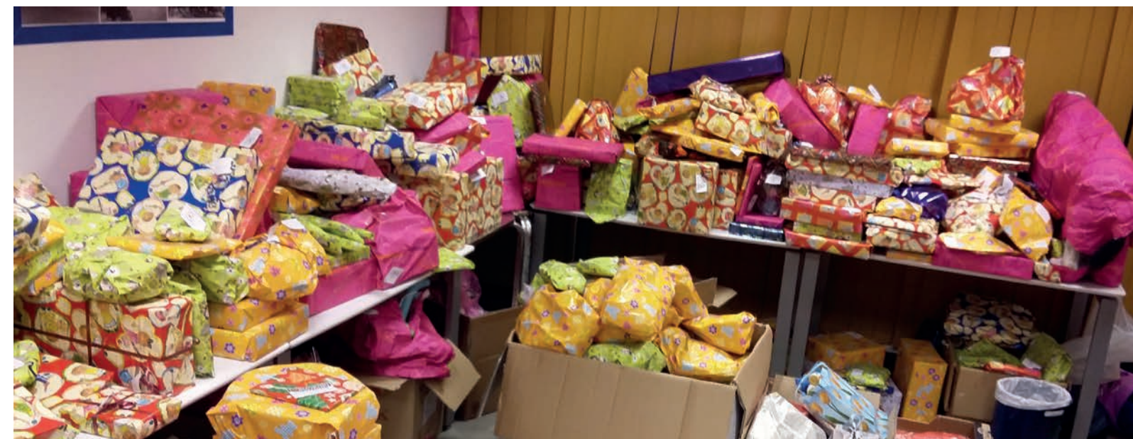
Juguetes de segunda mano, pero en buen estado, están envueltos para la Navidad.

estado, pero que ya no son necesarios para los hijos de los empleados. Poco antes de la Navidad, los juguetes se vuelven a poner en forma. Los peluches se lavan, las Barbies se arreglan el pelo y los coches se limpian. Las caras sonrientes y las risas de los niños nos muestran cada año de nuevo que con pequeños gestos se pueden conseguir grandes cosas. Y hacemos algo contra el exceso de consumo.