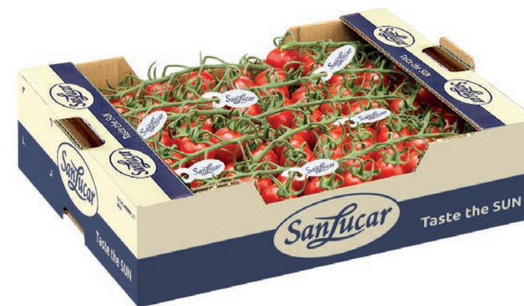
Vendemos frutas y verduras sin envase siempre y cuando sea posible.