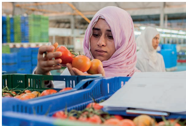
La calidad nos importa. Por eso controlamos nuestros tomates cuidadosamente.