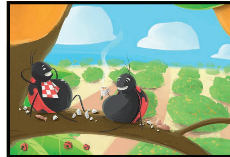
... y evitan la reproducción de las plagas.