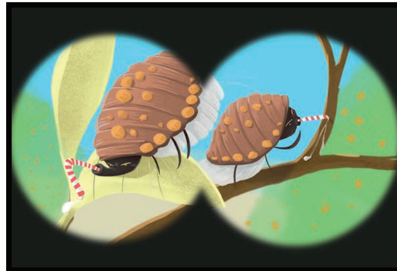
Las cochinillas chupan la savia de las plantas y las ponen en peligro.