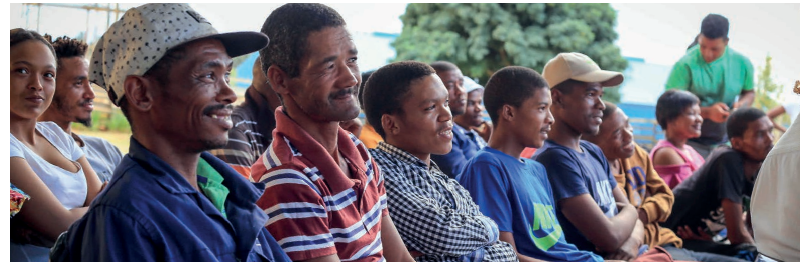
Los habitantes de nuestra finca aprenden todo sobre una vida sana en los talleres.