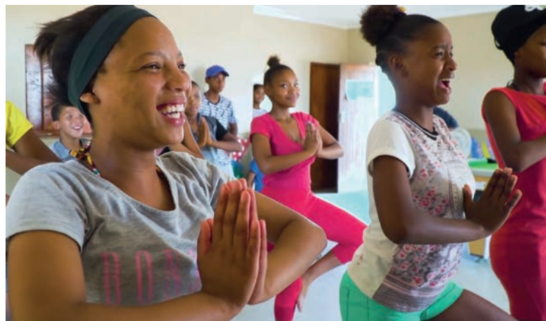
Mantenerse en forma gracias a la nueva sala de fitness.

Queremos que lleven una vida sana y esto incluye una dieta equilibrada. Por eso, juntos con nuestros partners, hemos creado jardines de permacultura en nuestras fincas Rooihoogte y De Hoek. Los habitantes de nuestra finca ahora pueden cosechar diariamente vegetales, frutas y hierbas frescas. La mayor parte de la cosecha se va a la cocina de nuestro jardín de infancia Speelskool, el resto se vende a los habitantes en una pequeña tienda. Las ganancias van directamente a la cuenta de la comunidad.