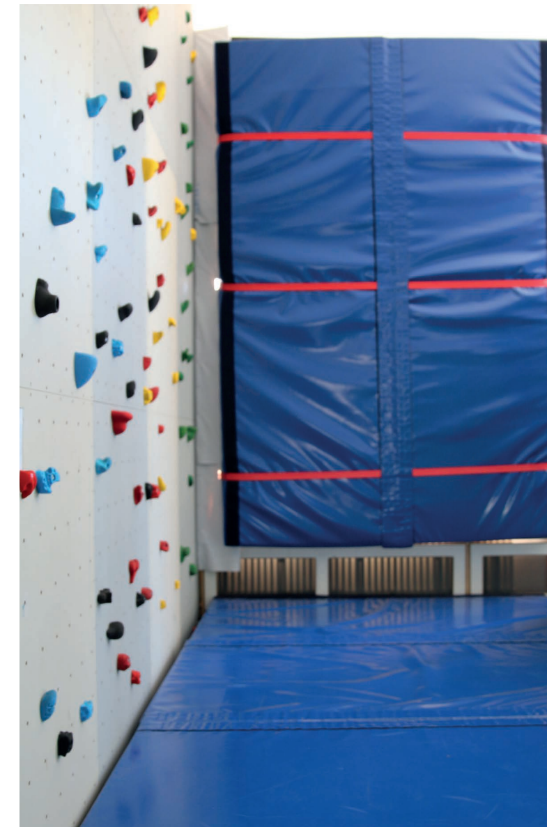
Quien cae, cae suavemente – gracias a las colchonetas protectoras.