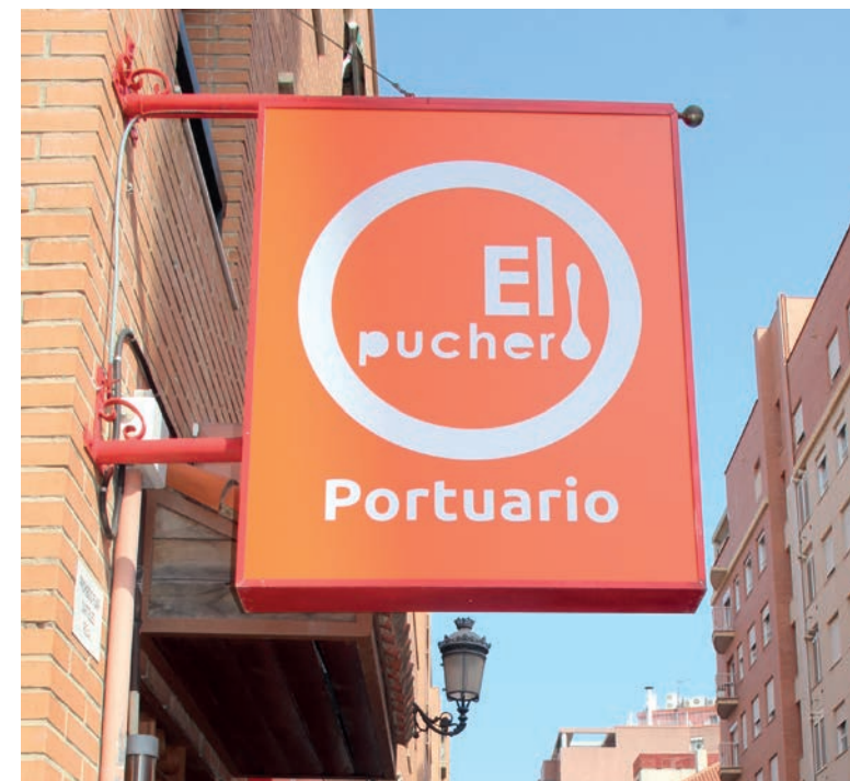
En abril 2018 abre el segundo El Puchero.

Los usuarios de «El Puchero» se llevan la comida a casa para poder comer con sus familias en un ambiente confortable. Nuestro objetivo a largo plazo es, que la gente sea independiente. Por eso es importante para nosotros que la gente vuelva a trabajar otra vez. Les ayudamos con las solicitudes de empleo y les ofrecemos cursos que les facilitan la entrada en el mercado laboral. Además, hacemos que los ojos de los niños se iluminen con, por ejemplo, donaciones de material escolar o regalos en la fiesta de Navidad.