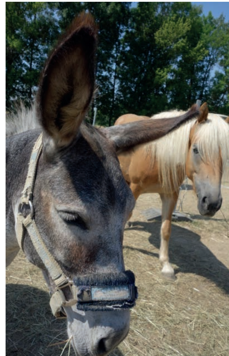
Los caballos y burros de terapia son muy sociables.