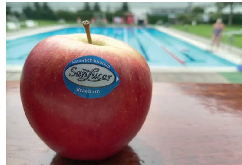
Pequeño refresco para los jóvenes deportistas del Club an der Alster.