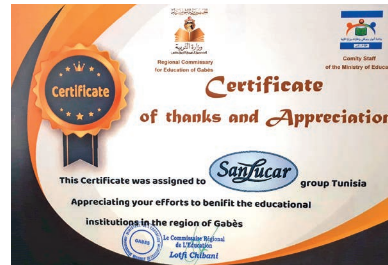
Recibimos un premio por promover la educación en el sur de Túnez.