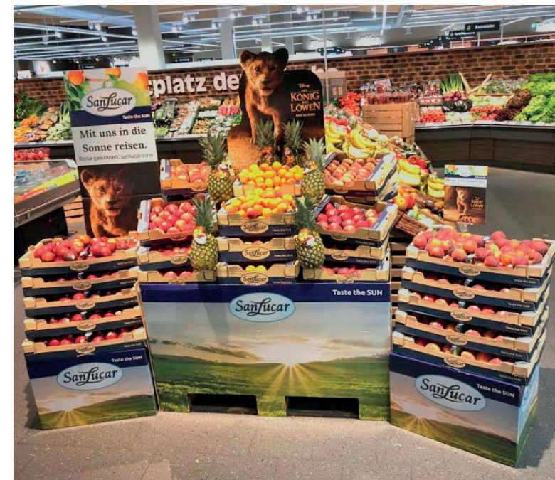
El león Simba se entroniza sobre piñas, melones, uvas y frutas de hueso.

León, y también héroes de dibujos animados como Astérix y Obélix, el Grinch o la abeja Maya adornan los envases de nuestra gama. De esta manera ayudamos a aumentar el deseo de vitaminas frescas. Muchos padres confirman que sus hijos prefieren comer nuestras frutas »divertidas« en lugar de las barras de chocolate. En el verano de 2019 tuvimos una fuerte campaña publicitaria en el punto de venta. Pruébalo con las frutas frescas de SanLucar, por una nutrición saludable con placer desde el principio.