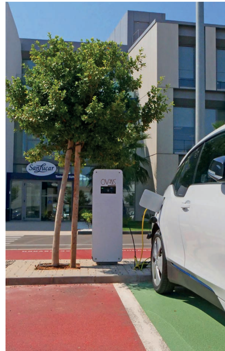
Nuestro estacionamiento también es sostenible y promueve un futuro más verde.

Y por supuesto usamos el agua con moderación. Hemos instalado sensores que detectan cuando el agua ya no es necesaria, por ejemplo, al lavarse las manos o a la descarga del inodoro. Las células solares en nuestro tejado proporcionan agua caliente.