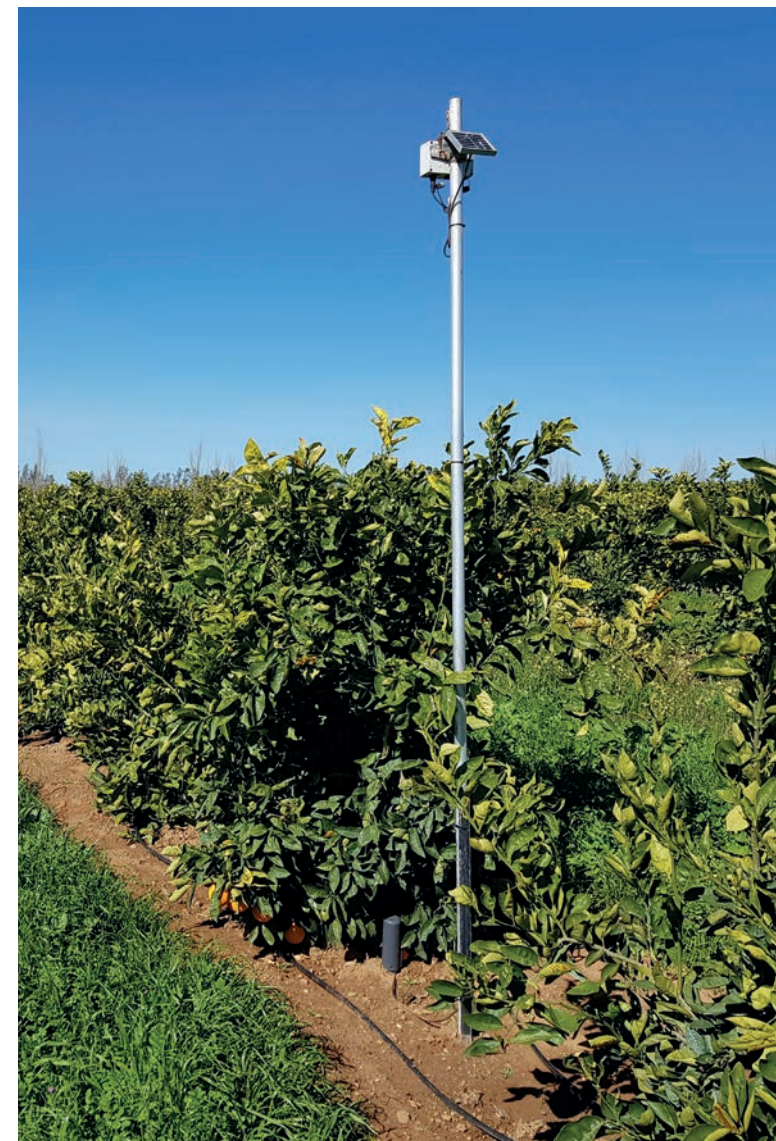
Las sondas miden la humedad del suelo en las raíces de las plantas.

Un instrumento muy inteligente para calcular la cantidad óptima de agua está en nuestra finca de cítricos en Sudáfrica. Allí tenemos 25 sondas subterráneas que miden la cantidad de agua disponible para la planta. Además, la evaporación total del agua de los árboles y los datos climáticos, como la temperatura, el viento y la radiación solar, son registrados y calculados por un sistema informático. Con este sistema ya hemos sido capaces de ahorrar el 50 % del consumo de agua. De esta manera podemos asegurarnos de que todas nuestras plantas tengan exactamente la cantidad adecuada de agua en todo momento para crecer y lograr la calidad tan especial de nuestra fruta. Por supuesto, nuestra agua siempre proviene de fuentes reconocidas oficialmente para las que tenemos licencia. El agua es uno de los recursos más importantes para nosotros.