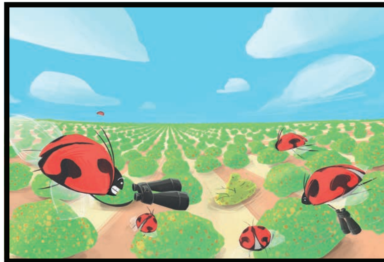
Rodalia cardinalis es una mariquita roja con manchas negras.