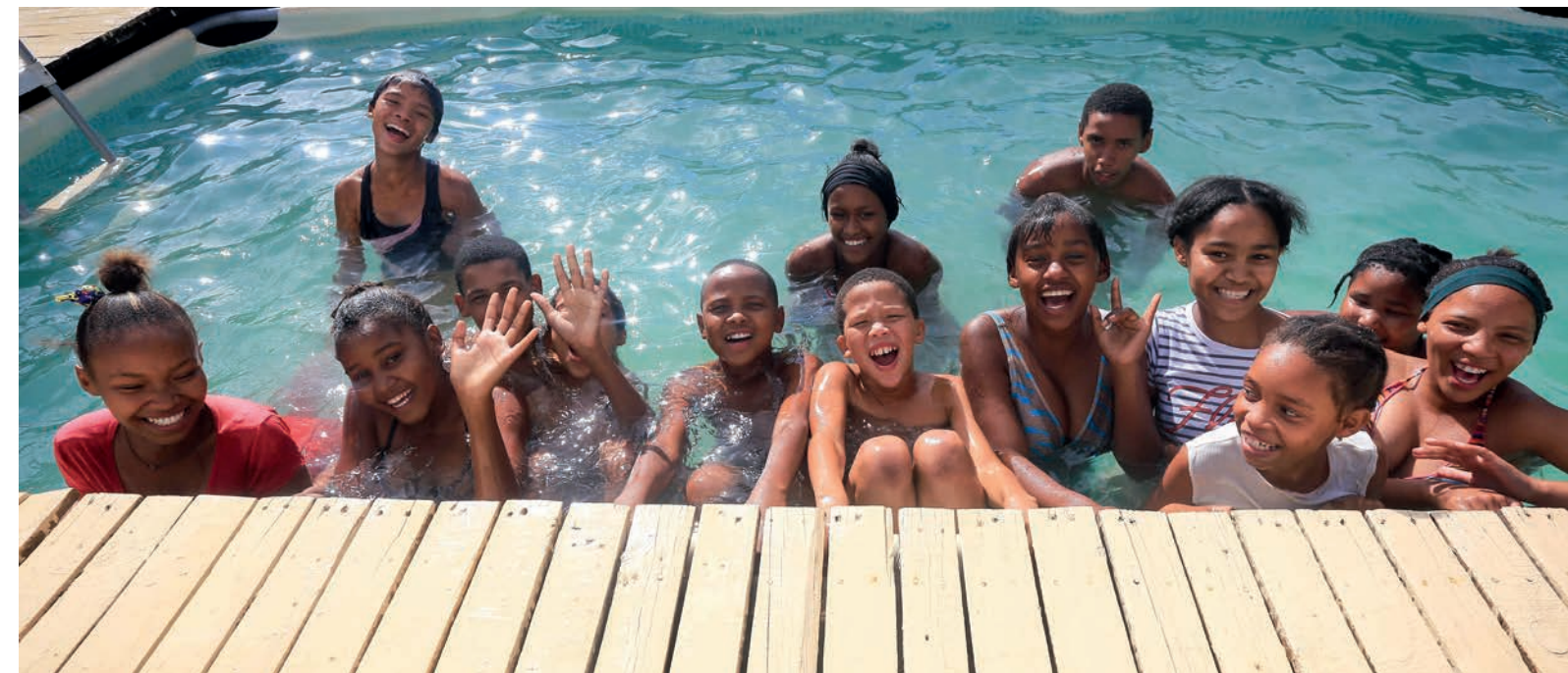
La piscina nueva les hace más que feliz a los niños.

de «ayudar a la gente a ayudarse a sí misma», los habitantes de la finca participan activamente en la realización de los sueños. Sólo así se sienten realmente parte del proyecto. »En 2012 SanLucar se hizo cargo de la finca Rooihoogte. Han pasado muchas cosas desde entonces. Estoy muy orgullosa del moderno jardín de infancia, nuestra Speelskool, con 40 a 45 niños.«