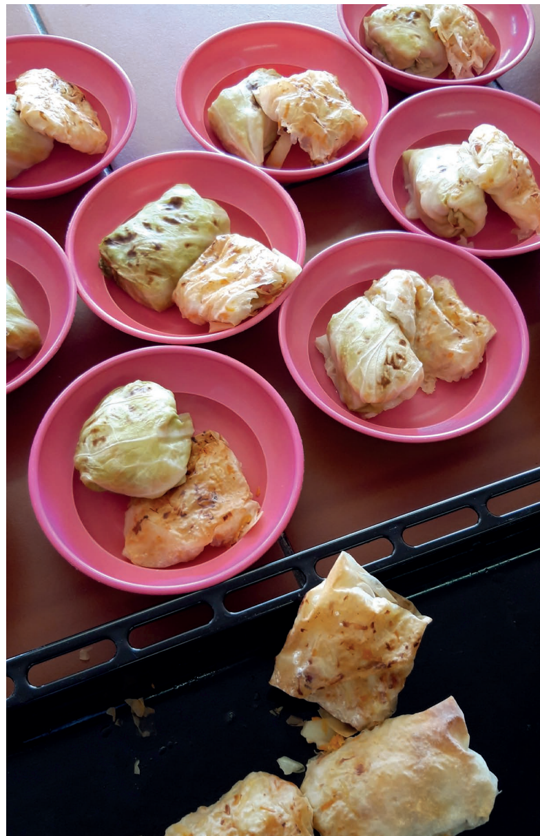
Recetas de verdura creativas, que hasta los niños disfrutan.