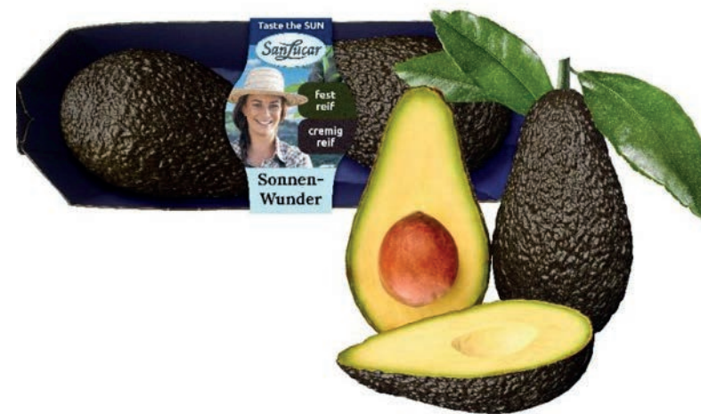
Nuestro envase del aguacate es sin plástico.

Los plátanos, limones o naranjas tienen una cáscara resistente que los protege del sol, de la suciedad, y de los daños. Ya ofrecemos más del 70 % de nuestra fruta sin envase. En los últimos cuatro años ya hemos podido ahorrar 687 toneladas de plástico. Y si los consumidores traen sus propias bolsas reutilizables, ¡mejor aún!