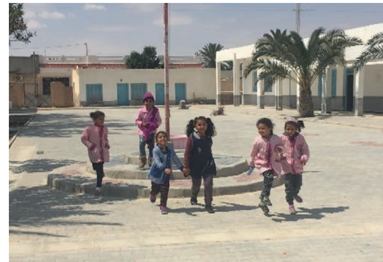
Así es como la escuela es divertida: el patio de la escuela y el área exterior se hacen bonitos.

Pizarras rotas, escritorios escolares rotos, materiales escolares deficientes – estas no son buenas circunstancias para estudiar. Con el gobierno tunecino, estamos renovando las escuelas primarias de la región de El Hamma, en el sur del país. Estamos reparando las instalaciones exteriores y los patios de juego, hemos comprado nuevas mesas, sillas y dispensadores de agua potable y hemos renovado las aulas y las instalaciones. Los niños y los profesores finalmente se sienten cómodos de nuevo y pueden concentrarse mejor en las clases.