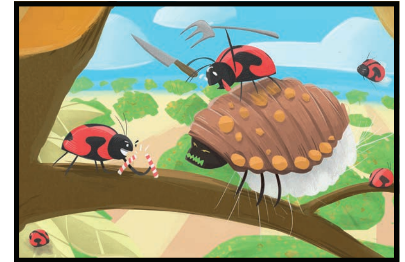
Las mariquitas se comen las cochinillas...