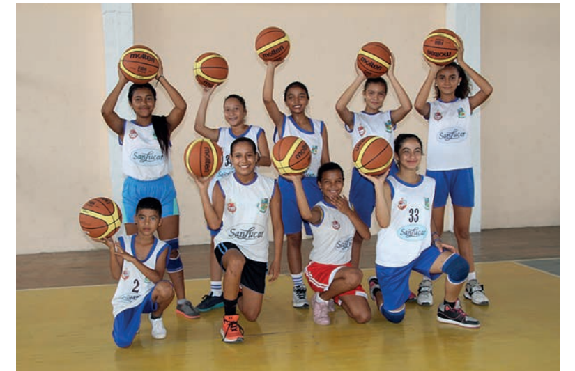
Con nuevos balones jugar es más divertido para los niños de DREAMS.