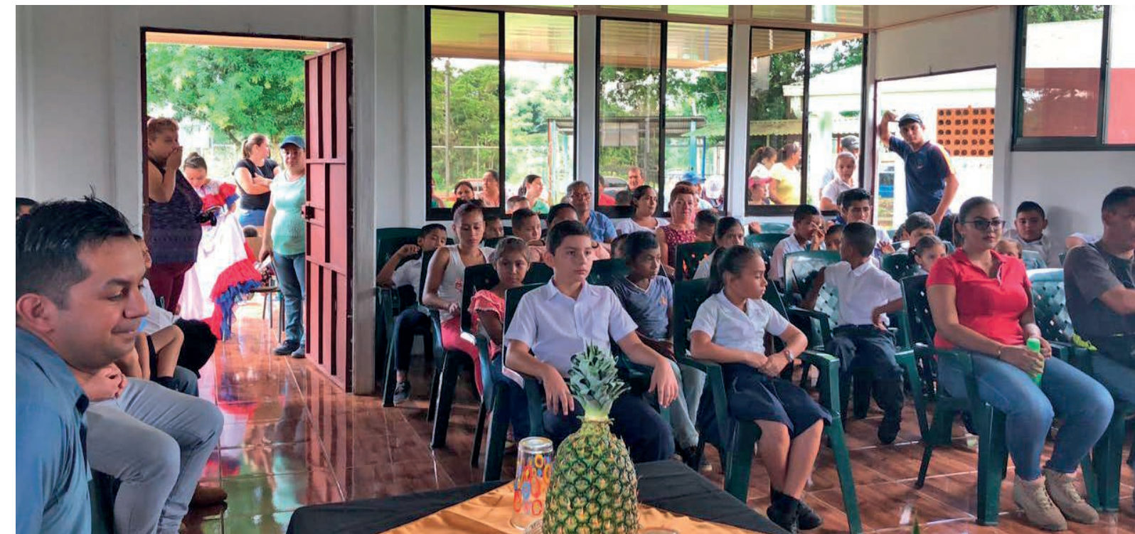
En la ceremonia de apertura de la nueva aula multiusos en noviembre de 2018, los niños aprenden inglés y música.

la escuela también debe expandirse. Junto con nuestro colaborador de cultivo de cultivo hemos creado un aula multiusos adicional. Fruver se ha ocupado de que la habitación esté construida y amueblada. Y nosotros hemos puesto el techo encima. En noviembre de 2018 los niños de la escuela primaria de La Legua celebraron la apertura con sus familias.