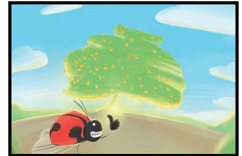
Una vez que el árbol se libere de la plaga, volverá a brillar en plena floración.