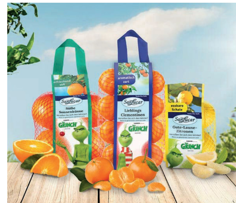
Los personajes populares de los envases animan a los niños a comer fruta saludable.