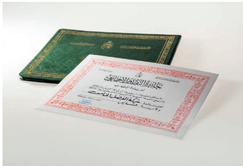
Reconocimiento y premio por nuestra continua acción local.

En 2018, recibimos el premio al compromiso social excepcional del presidente de Túnez. Usamos el dinero del premio para comprar el equipo médico necesario para el hospital local de El Hamma.